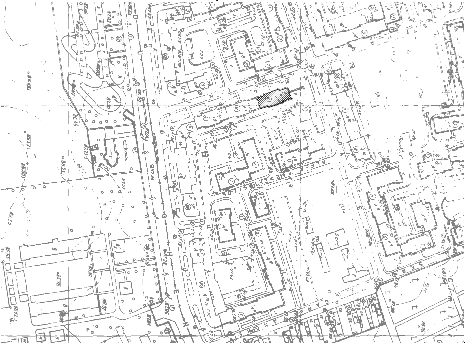
PLAN DE SITUATIE, SCARA 1:2000